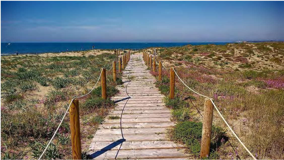
Passerella lato nord

Il progetto si propone ripristinare e ridare decoro all'unica strada (ora quasi impraticabile) che porta all'area dunale dove si trovano le dune di Passoscuro ed è possibile ammirare la splendida flora e fauna.