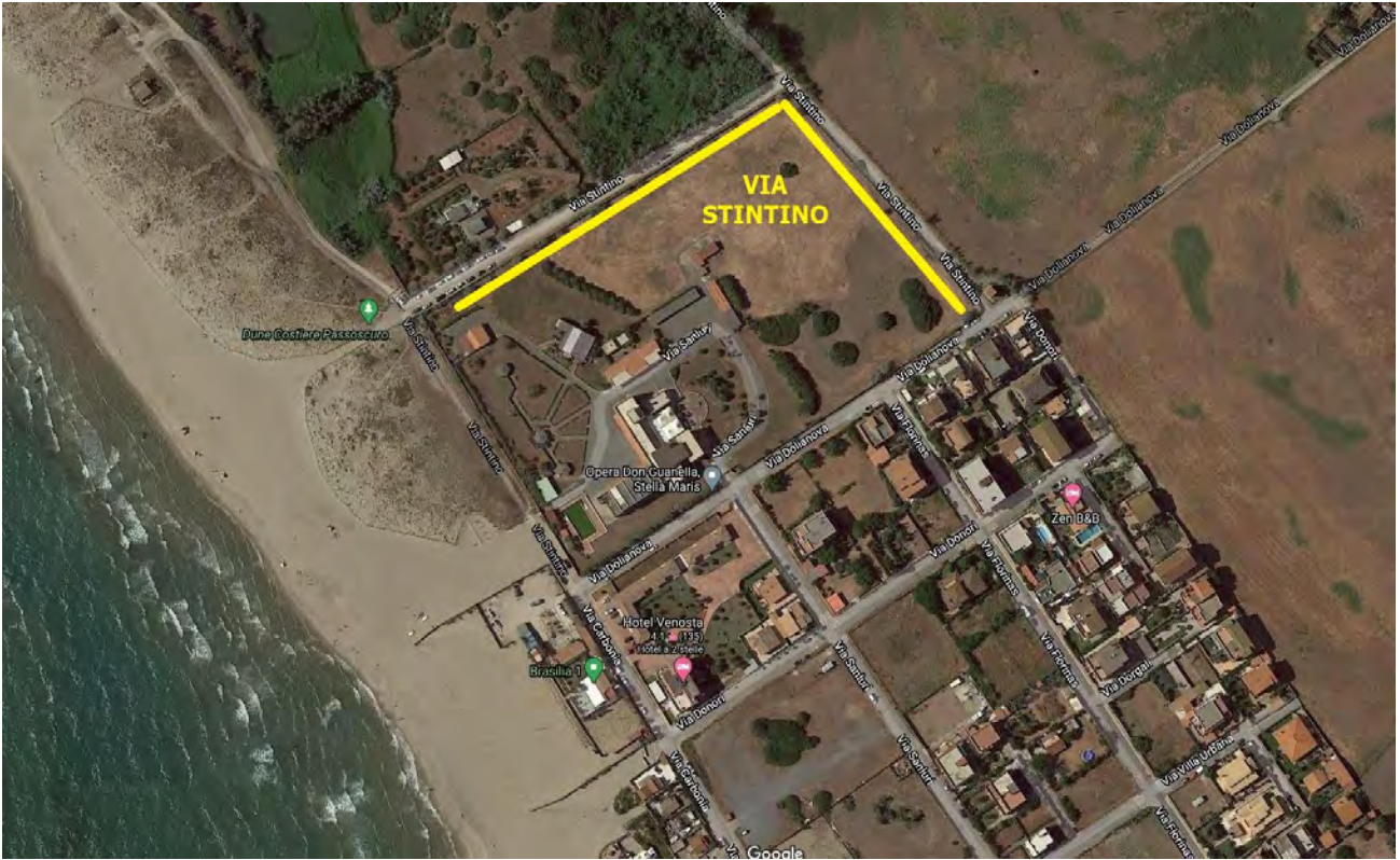
Google Maps – Via Stintino