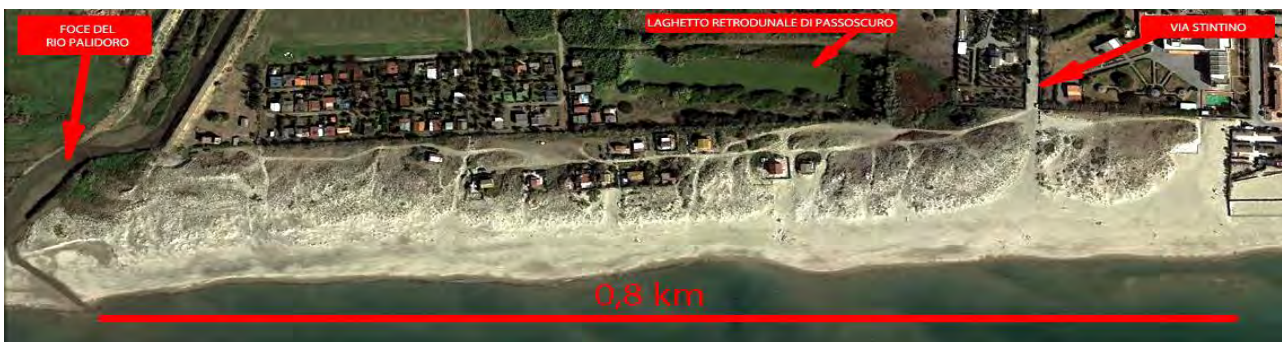
GoogleMaps - Tratto dunale dalla foce del Rio Palidoro a

La strada che porta alle dune di Passoscuro, denominata Via Stintino, si trova nella zona nord del comune di Fiumicino ed è l'unico accesso veicolare per raggiungere la piccola oasi naturale. Le Dune di Passoscuro appartengono all'area 1 (maggiore protezione) della Riserva Naturale Statale del Litorale Romano , creata nel 1996 per arginare l'urbanizzazione selvaggia su aree di enorme valore naturalistico, paesaggistico e archeologico, e ne rappresentano la punta più settentrionale.