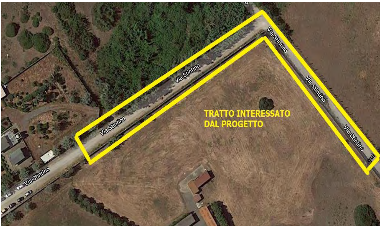
Particolare di Via Stintino