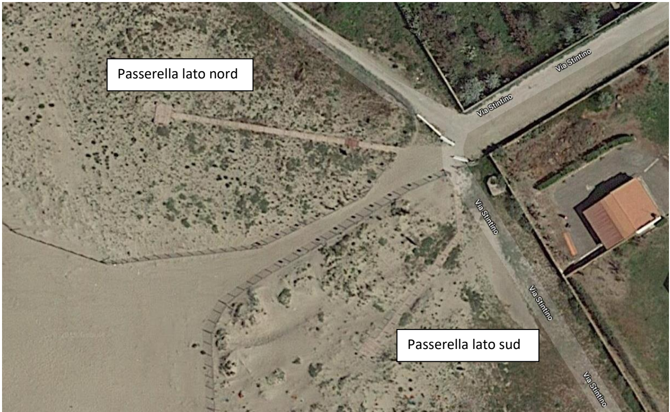
GoogleMaps – particolare passerelle