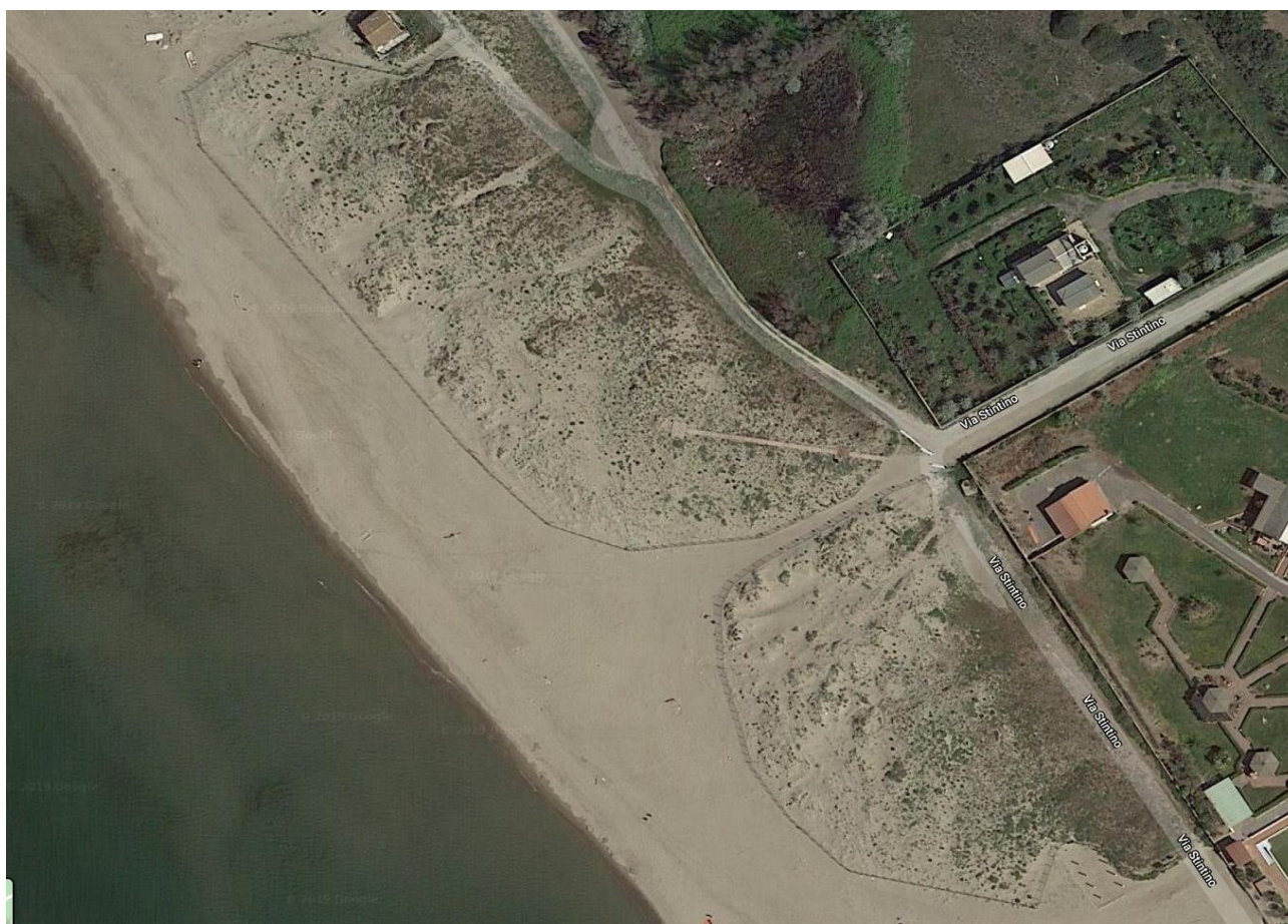
dune di Passoscuro