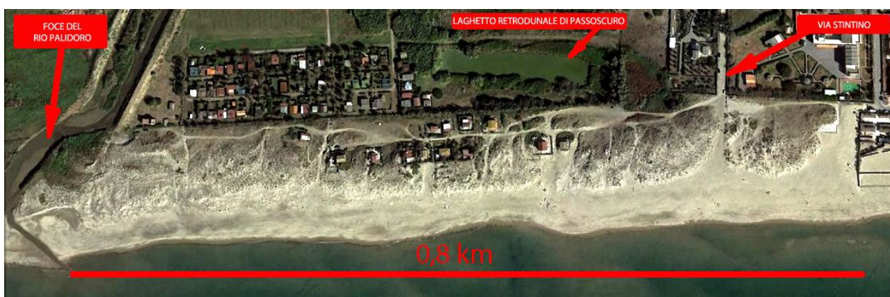
GoogleMaps - Tratto dunale dalla foce del Rio Palidoro a Passoscuro

Le Dune di Passoscuro-Palidoro appartengono all'area 1 (maggiore protezione) della Riserva Naturale Statale del Litorale Romano , creata nel 1996 per arginare l'urbanizzazione selvaggia su aree di enorme valore naturalistico, paesaggistico e archeologico, e ne rappresentano la punta più settentrionale.