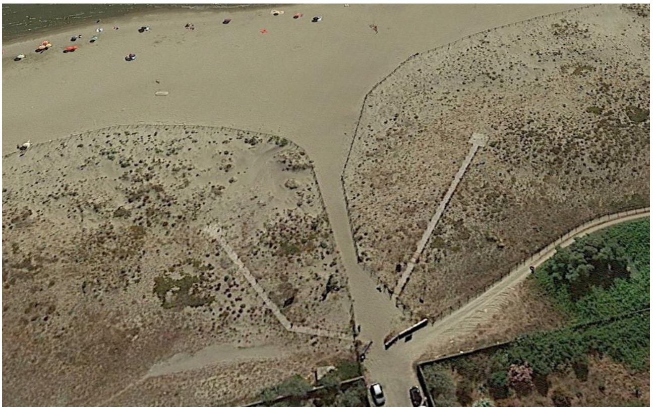
particolare passerelle