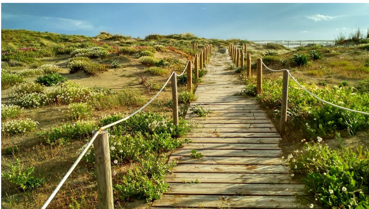
Passerella lato sud